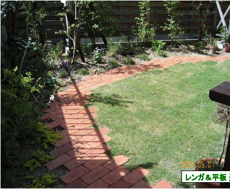
レンガ&平板 通路&芝・植栽

植栽部分 手入れを考え狭くしましたが、高低差をつけることにより、多くの植物を楽しめます